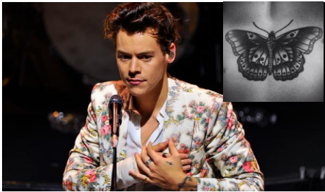
Harry Style Chanteur