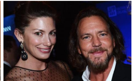
Eddie Vedder Chanteur du groupe Pearl Jam