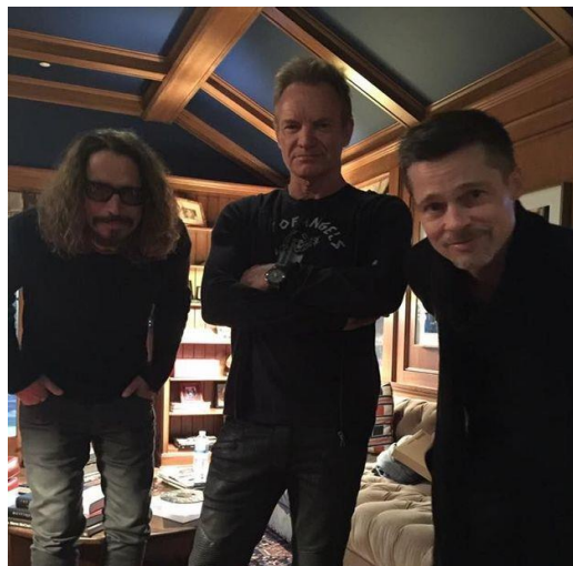
STING BRAD PITT