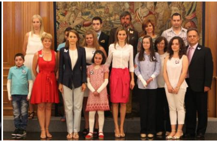
Letizia Ortiz Rocasolano Reine consort d'Espagne